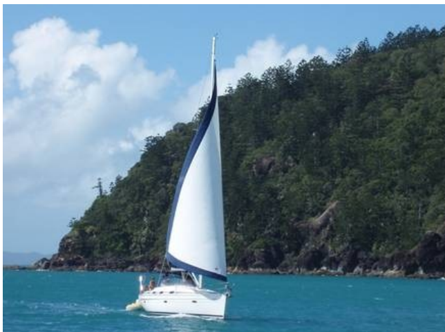
Rys. 3: Nie możesz wpływać na kierunek wiatru, ale zawsze możesz odpowiednio ustawić żagle.

Jak mawiał Henry Ford: „Porażka to tylko szansa na mądrzejsze rozpoczęcie od nowa”. Zdobądź się na odwagę i wyjdź poza strefę komfortu. Wizualizuj efekt osiągnięcia celu i swoją radość z tego tytułu. Ustalaj racjonalne i jednocześnie ambitne cele.