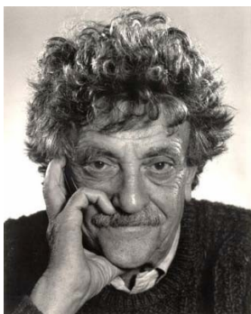
Rys. 5: Kurt Vonnegut.

Strategia osiągania celów Vonneguta pochodzi od znanego, genialnego powieściopisarza — Kurta Vonneguta. Odzwierciedla ona sposób, w jaki Vonnegut pisał swoje książki, tworząc fabułę i rozwijając wątki od tyłu.