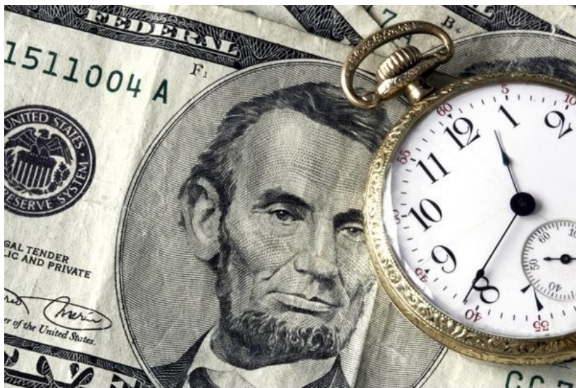
Rys. 6: Czas to pieniądz.