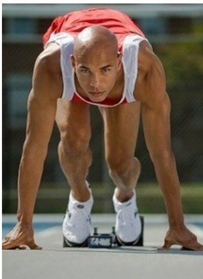
Rys. 8: Koncentracja na celu.

Kluczową umiejętnością prowadzącą do osiągnięcia celu jest umiejętność koncentracji na nim. Wszyscy ludzie sukcesu nauczyli się koncentrować się na jednej rzeczy i trwać przy niej tak długo, aż zostanie zrobiona. Skupienie to zdawanie sobie sprawy z tego, czego się chce. Koncentracja to dyscyplina i siła woli, która pozwala Ci poruszać się w wybranym kierunku, aż do końca.