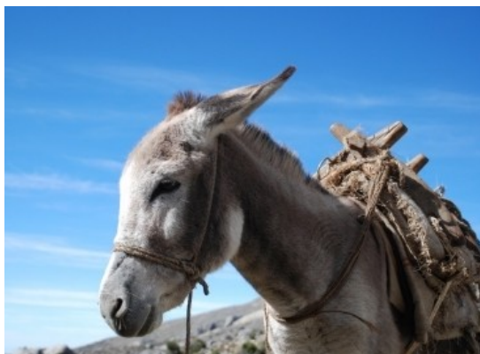
Rys. 9: Osiołek.