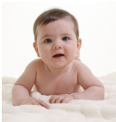
Rys. 7: Raczkujące dziecko.

Większość ludzi oczekuje natychmiastowych rezultatów. Pamiętaj jednak, że osiągnięcie celów to nie przygotowywanie posiłku fast-food! To sztuka, którą jeśli dobrze opanujesz — zadziwi Cię swoimi wynikami! Trzeba jednak czasem poczekać... Daj sobie czas i kolejne próby, w razie niepowodzenia.