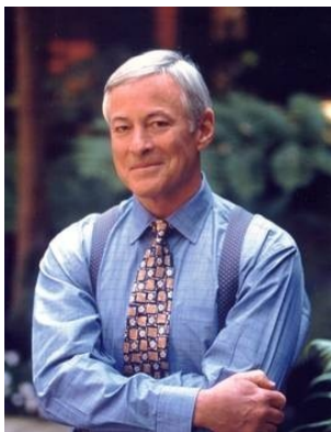
Rys. 4: Brian Tracy

Kilka słów o autorze metody. Brian Tracy jest dziś jednym z najbardziej uznanych w świecie mówców szkoleniowych w zakresie budowania osobistego i zawodowego sukcesu. Przemawia co roku do ponad 300 tysięcy osób.