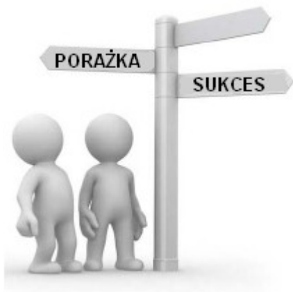
Rys. 1: Wybór należy do Ciebie.

A więc w tym kursie liczy się to, jak szybko wprowadzasz wiedzę w życie i wykonujesz ćwiczenia.